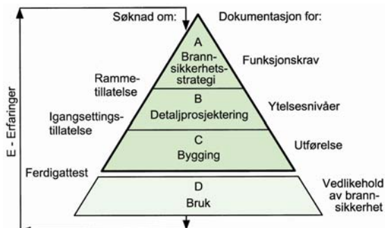
Figur 2: Ulike nivå for dokumentasjon av brannsikkerheit.

Formålet med dokumentasjonen på dei ulike nivåa går også fram av figur 2.