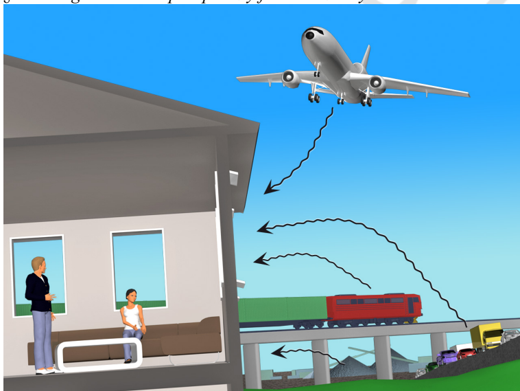
§ 13-9 Figur 2: Eksempler på støy fra utendørs lydtkilder.

For krav til uteoppholdsareal, se også § 8-4 .